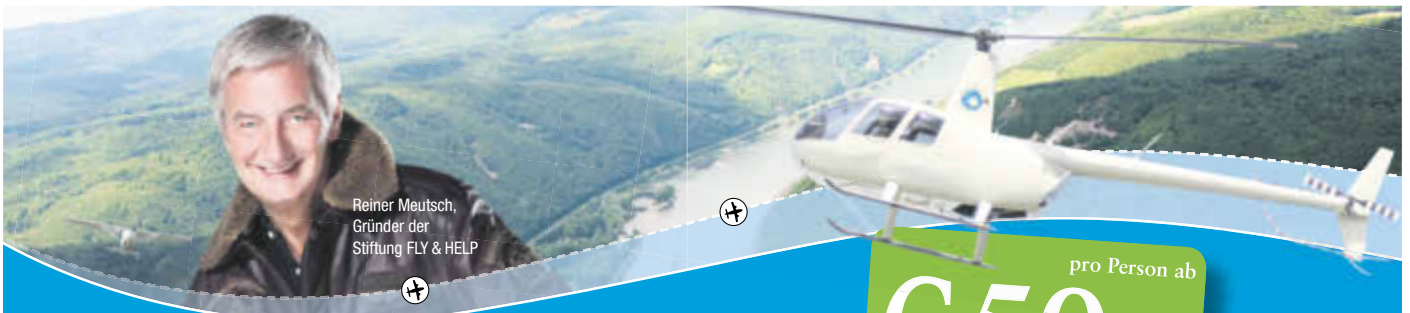
Reiner Meusch, Gründer der Stiftung FLY & HELP

Gesamtverbrauch l/100 km: kombiniert von 8,4 bis 4,1; CO 2 -Emissionen: kombiniert von 199,0 bis 95,0 g/km (Messverfahren gem. EU-Norm); Effizienzklasse E-A.